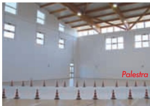
nella nostra "vecchia scuola".

Allora abbiamo avuto l'idea di diffondere attraverso il giornalino le notizie che riguardano la vita in questa nuova scuola... Essa è molto grande, soprattutto la palestra, che purtroppo, però, non può essere ancora utilizzata come tale perché è usata per l'entrata e l'uscita di noi ragazzi. Per questo motivo facciamo educazione motoria