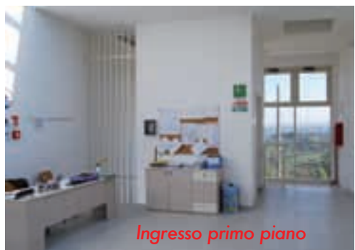
Ingresso primo piano