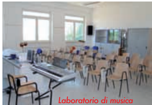
Laboratorio di musica