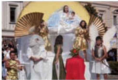
Palio di Perignano

Questo settembre anche Lari è stato animato da una serie di eventi che ha preso il nome di 'Lari...amarcord'. Tutto è iniziato con la riproposizione del torneo di calcetto fra i quattro rioni, che ha animato p.zza XX settembre tra il 10 e il 12 settembre, ed ha visto vincitore il rione 'La Villa'. Sabato 11 è stata la volta della corsa podistica 'Corri in Castello'. Venerdì 1 ottobre è andata in scena 'Lari... in Moda' sfilata di moda organizzata dalla Vivi Lari, che nonostante fosse stata rimandata a causa del maltempo e spostata da P.zza Matteotti al salone S. Anna, si è rivelata un vero successo sia per il pubblico che per l'ottimo lavoro degli organizzatori. Tanti complimenti