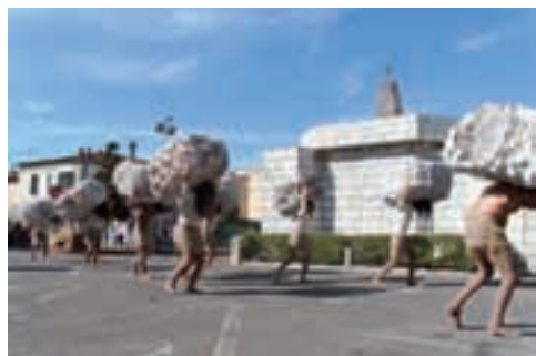
Palio di Perignano

finale ha visto le Tre Vie vincitrici. Il Palio con l'andare del tempo consolida la sua funzione aggregatrice del paese, in particolare in questo momento di forte espansione di Perignano fa sì che non diventi un paese di estranei, per questo motivo l'amministrazione crede fortemente in questa manifestazione e non farà mancare il suo sostegno.