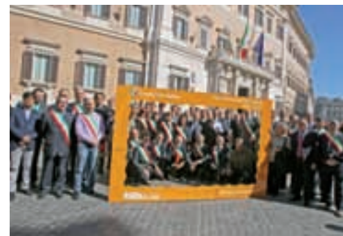
Conferenza a Roma

Si è conclusa con successo la prima Giornata Nazionale dei Paesi Bandiera Arancione improntata a far conoscere le piccole località dell'entroterra insignite del prestigioso marchio. Un appuntamento presentato in conferenza stampa a Montecitorio (Roma) e organizzato in contemporanea su 87 piazze italiane parte integrante di un percorso turistico d'eccellenza, non omologato e fuori dal comune, che esalta naturalezza e tipicità. Coloro, e sono stati molti, che hanno partecipato alle numerose attività in programma hanno dimostrato entusiasmo e soddisfazione. Una scelta davvero appagante per l'Associazione Bandiere Arancioni, il TCI e le Amministrazioni Comunali che hanno colto l'opportunità di valorizzare il proprio patrimonio culturale privilegiando i valori della qualità e dell'accoglienza. Un'esperienza che si è rivelata positiva anche per la nostra comunità che grazie all'impegno e alla disponibilità