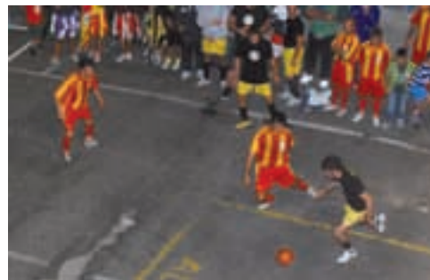
Lari. Torneo di calcio

Nello stesso fine settimana si è svolto anche quello che è l'evento più atteso a Perignano, ovvero, il Palio delle Contrade, che è arrivato alla sua 26ª edizione. Sabato 11 si è svolto il Mini Palio che ha visto per la prima volta vincitrice la Contrada Spinelli, domenica pomeriggio è andata in scena la sfilata storico-folkloristica, la medaglia d'oro è andata alla Contrada 4 Strade, infine al termine della sfilata è stata la volta del Palio della Bilancia che anche quest'anno al termine di una combattuta