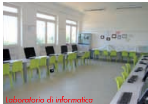
Laboratorio di informatica

Aver a disposizione un ambiente così nuovo ci fa pensare che sia una bella cosa e per questo piano passerà l'amarezza di aver lasciato Perignano.