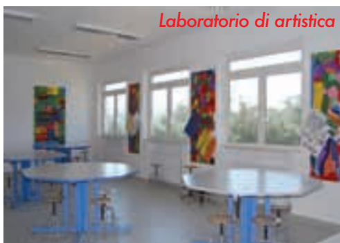
Laboratorio di artistica